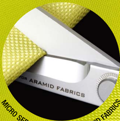
MICRO SERRATED EDGE FOR ARAMID FABRICS